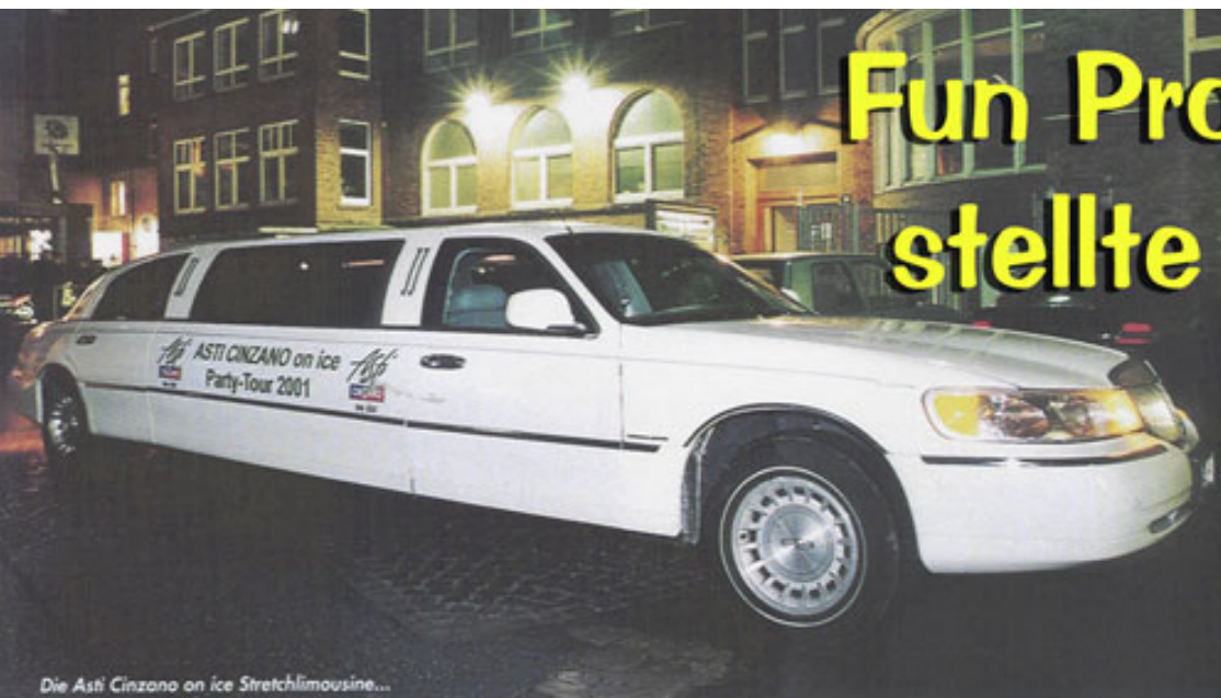
Die Asti Cinzano on ice Stretchlimousine...