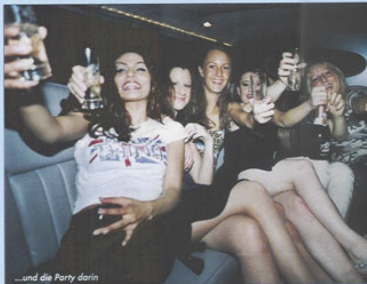
...und die Party darin

CINZANO-Party chauffieren zu lassen. Des Weiteren bekommt jeder Gastronom als zusätzliches Bonbon eine aufwendige Erstausrüstung mit Gläsern, Kühler etc. gratis.